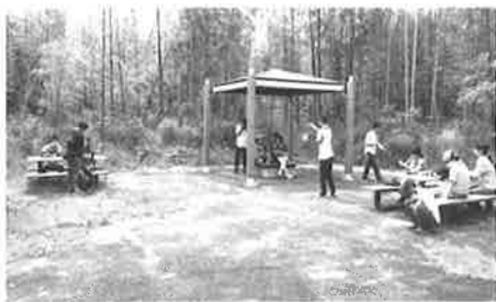
木陰でゆっくり休憩

最近少しずつですが下請け作業が再開しました。仲間たちは、充電期間を経て、より一層作業への意欲が高まっています。今後も、季節に合わせてみんなで楽しめる取り組みを考えていきます。