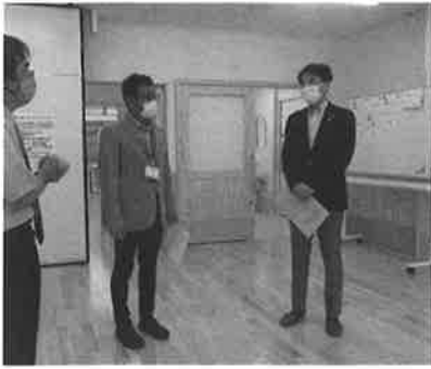
▲6/19 一宮市長さん内覧会に来所