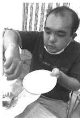
フォークで食べるよ

取り組みでパフェづくりを行いました。コロナ対策として作り方を簡略し、カップに材料を入れ、それを積み上げるよう工夫をしました。パフェは出来栄もよくみんなで美味しくいただきました。