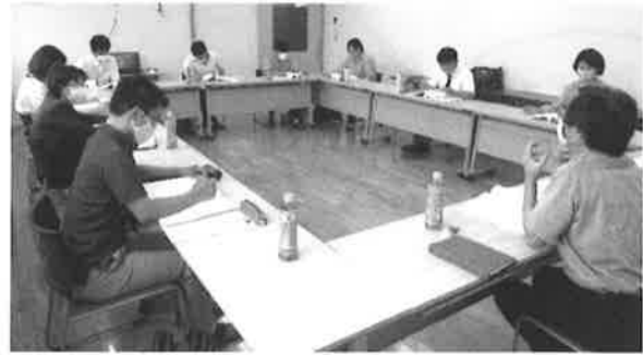
7月1日 オリエンテーション 新規職員

自己紹介に続き、法人の歴史・障害者福祉諸制度・発達保障等について、資料学習と共に、動画も活用しながら取り組みました。これから相互に高め合いながら、きそがわ福祉会の未来を切り拓き活躍していただけたら素晴らしいと思います。