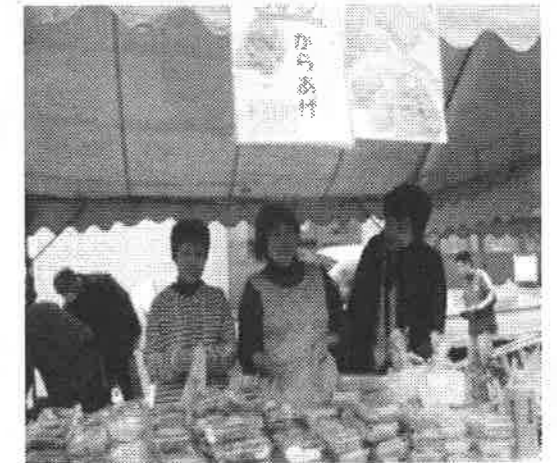
ホームの人たちもいっぱい作って、がんばりました!

呼び込みや、参加された保護者の方やボランティアさん達の奮闘、新聞折り込みの効果などにより、晴天だった昨年を上回る収益を上げることができました。雨の中、販売の呼び込みをされた皆さん、終了後の片付けで、すび濡れになりながら力を貸していただいた皆さん、本当にありがとうございました。今後ともきそがわ福祉会をよろしく願います。