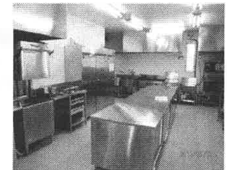
▲ふたばドリーム作業所厨房

【200食作れる厨房】 建物の特徴の一つは、大きな厨房設備のある事です。なかま・職員の昼食を作りますが、さらに、なかまの仕事としてお弁当事業も出来るように、200食作れる厨房となっています。 始まって1か月が経過したところでは、なかま・職員と一から創る作業所という感じですが、お昼の給食は、皆が楽しみとなり、今までなかった給食の話題も多くなりました。食べることは、誰にとっても楽しみです。