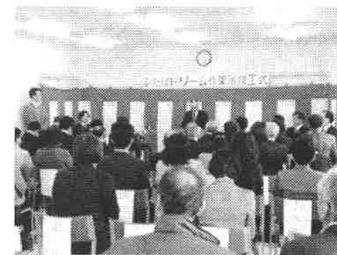
▲ふたばドリーム作業所竣工式の模様

た以上に利用希望者が増え、期待が高まる中で、多数の方の支援の元で、昨年度に続いての開所となりました。 竣工式当日は、大勢の来賓の方にお越しいただき、盛大な式典を行うことができました。 今回の新事業所の建設に伴って、黒田ドリーム作業所も含めて新規で15名の方を受けとめることができました。多くの方に喜んで利用していただき、その事が、職員にとっても励みとなり、頑張る気持ちを強くしております。