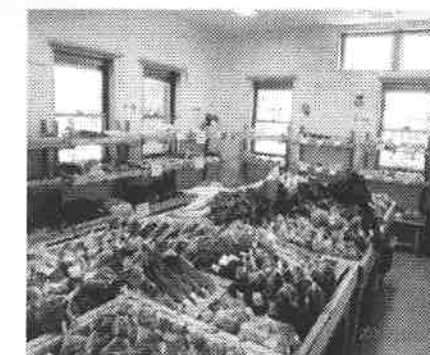
▲なごみの広場(ふたばドリーム作業所の店舗)

【店舗を併設】 もう一つの建物の特徴は、店舗を設置した事です。(店舗は5月2日オープン) きそがわ福祉社会の作業所に通うなかまの作る製品を販売していきます。産直野菜の販売も行う等、皆さんからのアドバイスをいただきながら、なかまと一緒に頑張っております。多くの方に足を運んでいただき、声をかけていただければ励みとなります。宜しくお願ひ致します。