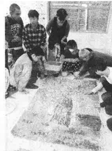
立派な桜が完成しました

黒田ドリーム作業所(本体)では、4月5日に創作活動を行いました。今回の創作活動のテーマは「桜」。ハサミやシユレッターを使い桜の花びらを作ったり、絵の具で木や風景などを思い思いに描いたりしながら、みんなで1つの作品を作りました。和気藹々とした雰囲気の中、1つ1つの過程でこだわりや工夫を持って楽しく活動することができました。