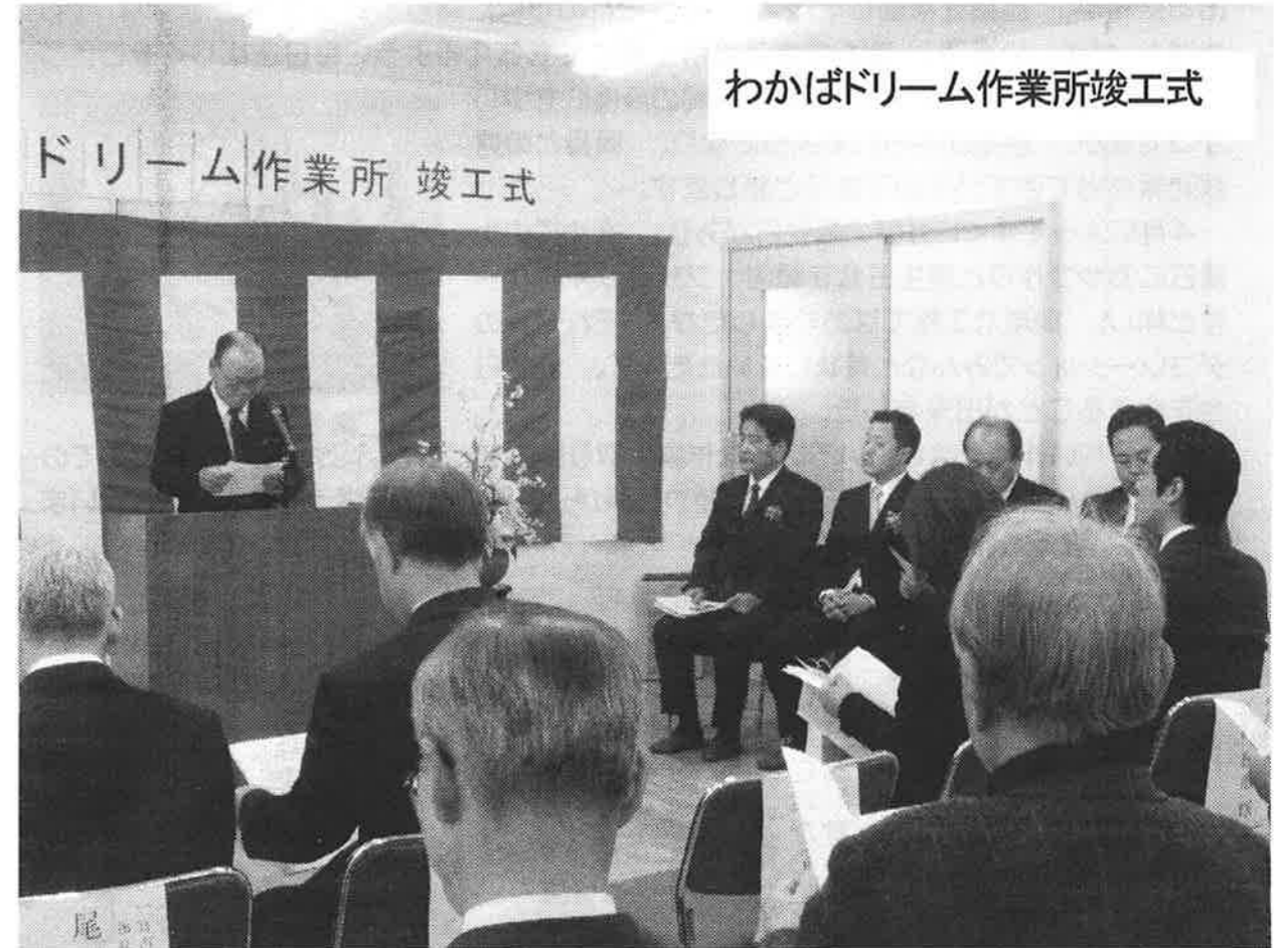
わかばドリーム作業所竣工式