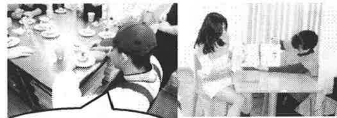
どんな顔にしようかな~