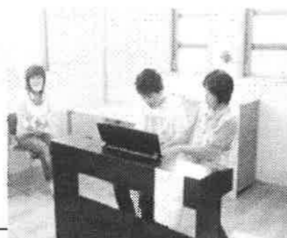
仲間もピアノ一緒に弾いちゃいます♪

歌のプログラムの中に自己紹介の歌、手遊びの歌というものがあり、新しい仲間が音楽を通して自己紹介をしたり手遊びを披露するなど仲間とのつながりを深める良い機会となっています。ちなみに新しい職員も仲間の前で自己紹介と手遊びを披露し、楽しい交流の場となっています♪