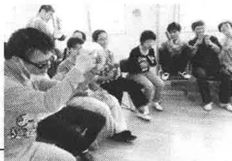
楽器も使ってリリリ♪

音楽活動に欠かせないピアノ演奏は2人の職員が行っています。お2人のピアノの美しい音色に仲間や他の職員も癒されています。今後も新しい歌や楽器を取り入れながら楽しい音楽活動を続けていきます♪