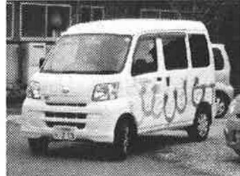
<相談支援センター-夢うさぎ>

車種 ホンダ N-WGN 1台 事業費総額 642,152円 助成金額 450,000円