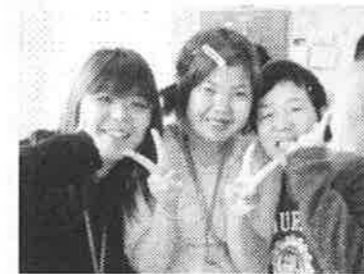
「楽しい会になりました♪」

黒田ドリームの誕生日会は、毎月、誕生日者の希望を聞いて企画を考えています。4月の企画は「カラオケ大会」。みんな歌うことが大好きで嬉しい企画となりました。マイクをしっかり握り、振り付けも大胆に、仲間も職員も一緒に盛り上がりました。日頃のストレスも発散できたかな・・・。来月はどんな誕生日会企画があるのでしょうか。期待しながら日々仕事に励んでいきたいと思っています。