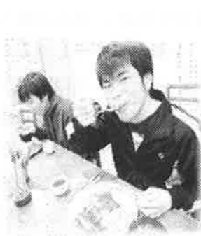
リクエストメニューの夕食 カツカレー☆☆

お楽しみの食事 北方ホームとぬくもりホームは、各ホームごとに、リクエストメニューの夕食と外食の取組みを行いました。