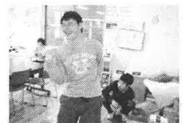
「次は僕が歌う番だ！！」