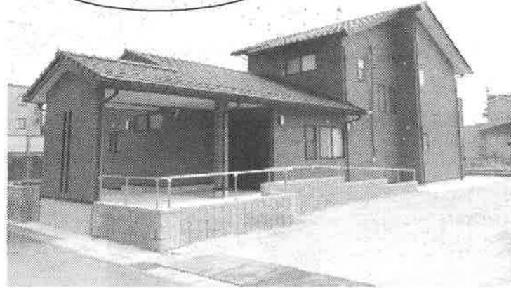
完成した「勅使ホーム」(延床面積182.68㎡) グループホーム定員5名+短期入所1名

一宮市北方町北方字勅使に、新設のグループホーム「勅使ホーム」が完成しました。 きそがわ福祉会の10ヶ所目のホーム住居になります。 この新設「勅使ホーム」は、一宮市グループホーム建設補助金を申請し建設しました。 グループホーム定員5名、短期入所定員1名での運営を予定しており、現在開所に向けて準備を進めております。