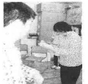
「誕生日おめでとう！」

黒田ドリーム作業所では今年度、新しい仲間と職員を迎えました。4月2日には歓迎会と4月の誕生日会を行いました。全員揃い、ジュースで乾杯をした後、新しい仲間・職員の自己紹介がありました。少々緊張気味の仲間もいましたが、元気に自分をアピールすることができました。緊張の中にも和気あいあいとした雰囲気があり、「これから一緒に頑張って行こう！」とみんなで確認できた会となりました。