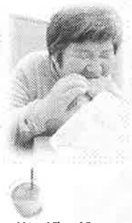
ハンバーガーショップにて

毎日の暮らしの中で食事は大切で、誰もが楽しみのひとつです。ホームでの食事の時間は仲間のみんなとの交流の場で、賑やかに食事を楽しんでいきます。リクエストメニューはみんな嬉しく、今回は『カツカレー』。みんな大好きメニューです。ハンバーガーショップでの外食も楽しめました。お肉系ばかりだったので、今度は野菜たっぷりメニューも取り入れたいと考えています。