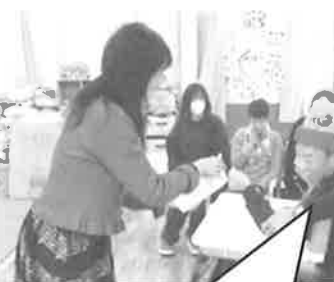
素敵な演奏ありがとう