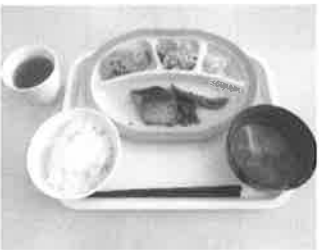
さばの味噌煮と きのこの当座煮