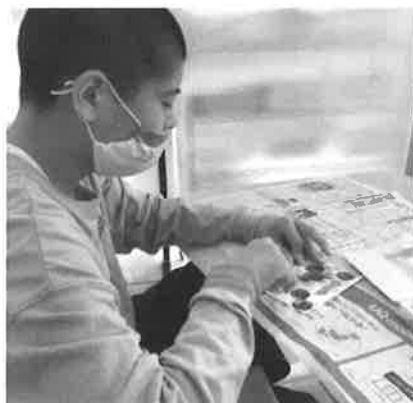
「大好きな電車を貼ったよ」

お小遣い20円を持って、近くのスーパーへおやつを買に行きました。好きなお菓子や普段おうちでは買わないお菓子を買い、「後で見せ合おうしよう！」とお披露目会もありました。初めて自分で買い物をする子も複数おり、お金の計算や買い物の流れなど、良い体験になったのではないかと思います。