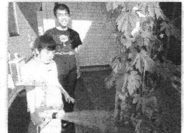
ゴーヤの収穫が楽しみです～♪