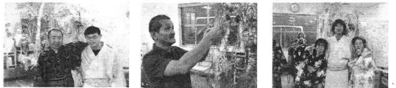
どう？ 似合うでしょ？

最後はサイダーにピンクと緑のゼリーを入れた、職員特製の七夕デザートを食べ締めくくりました。今年もみんなの願い事が叶いますように・・・。