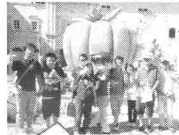
ハッピーハロウィン!!

帰りのバスは『シュガーラッシュ』のDVDを見てゆっくり……。皆様のご協力の下、無事に帰ることができ、みんなの笑顔がいっぱい見られた楽しい旅行となりました。