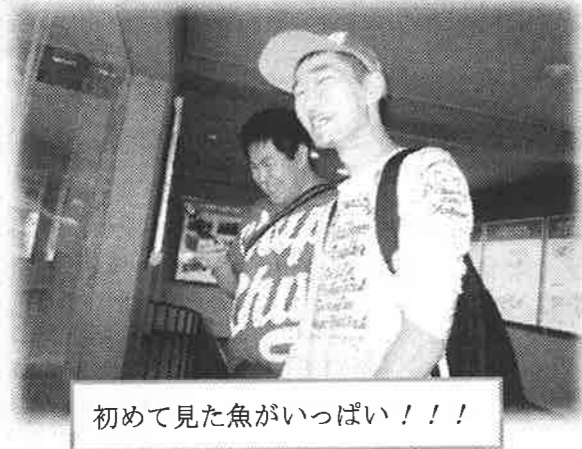
初めて見た魚がいっぱい!!!

二日目には志摩マリンランドへ。こはペンギンやマンボウが人気で、目にした仲間は「ペンギンかわいい♡」や「マンボウおっきい！」と大興奮でした。中には見たことのない魚を見て、自分で写真を撮る仲間もちらほら……。帰りには道の駅で風食をとり、三重県の特産品を見ました。あつという間の二日間でしたが、天気にも恵まれ、よりいっそう皆の仲が深まった旅行になりました。