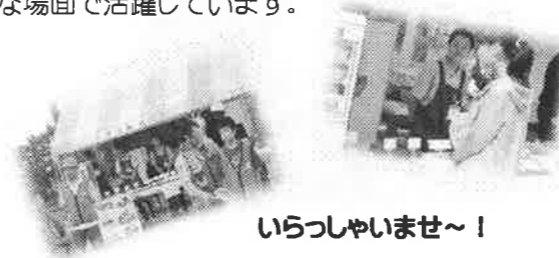
いらっしやいませ〜！

café KURODA の仲間は、喫茶での接客やキッチンでのお仕事、お菓子の製造作業、販売と日々様々な場面で活躍しています。