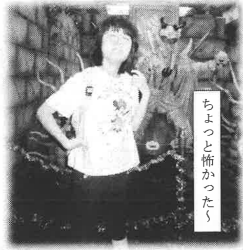
ちよつと怖かった〜

9月末に北方あすなろ作業所、初の一泊旅行に行ってみました！行き先は三重県伊勢・志摩です。お天気が心配な初日でしたが、目的の志摩スペイン村へ着くころには晴天に。みんなそれぞれ楽しみにしていたアトラクションを思う存分楽しむことができました。途中でパレードにも遭遇し、初めて見るフラメンコにははるく見とれている仲間もいました。宿泊したホテルではバイキングに温泉、カラオケなど充実した時間を過ごすことができました。