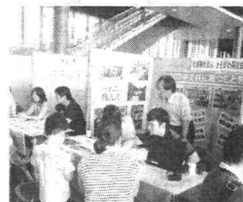
▲当法人のブースでの様子

「みらい」のまちづくりを、みなさんとの出逢いからをテーマに、一宮市障害者自立支援協議会・生活支援部会が主催となり一宮で初めての障害福祉のお仕事の就職説明会が、7月8日(日)に一宮駅のイビルで行われました。きそがわ福祉会も1ブースお借りして、参加してきました♪ 当日は晴天の中、たくさんの方に会場にいただきました。就職活動中の学生さんや心機一転を目指す転職希望の方、育児が落ち着いての職探しの方、きそがわ福祉会に興味のある方など、様々な【出逢い】がありました。スタンブラリーや夏祭りコーナーも賑やかで、お子様連れのご家族様もたくさんみえて、大盛況のイベントだったのではないのでしょうか。しかしブースの中は「サウナ」のように暑かったです汗