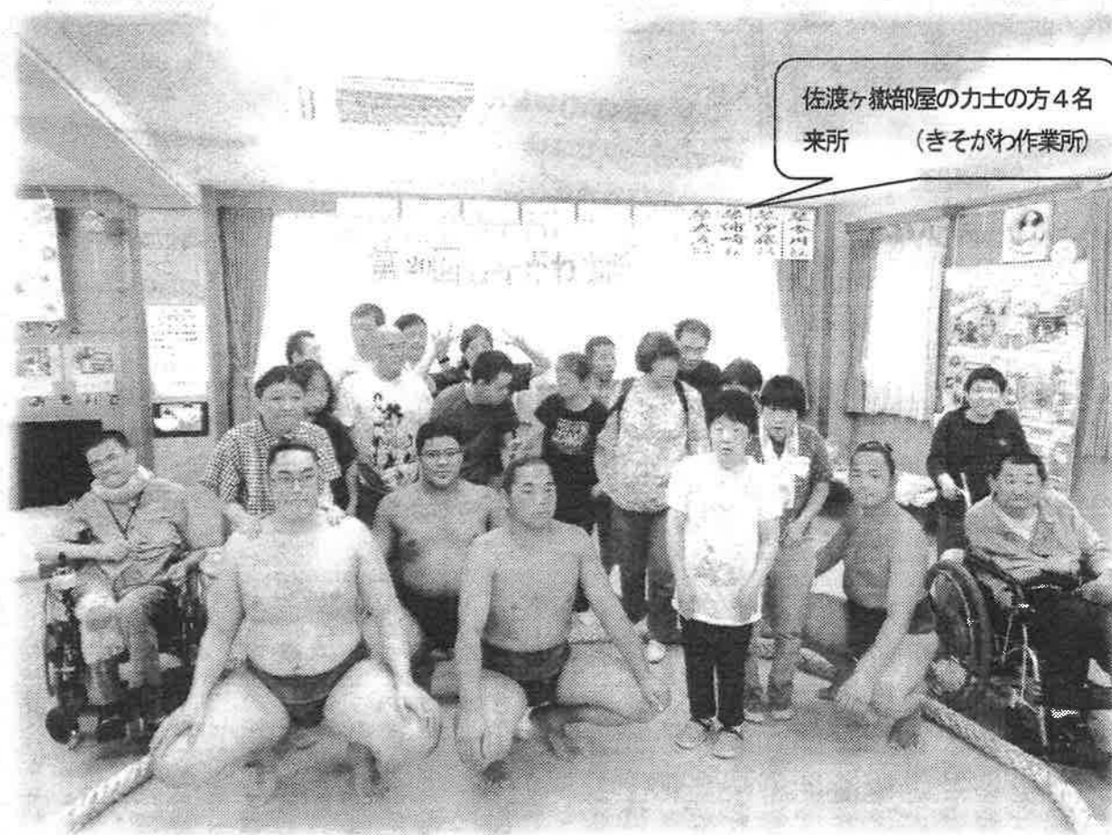
佐渡ヶ嶽部屋の力士の方4名 来所 (きそがわ作業所)

発行：社会福祉法人きそがわ福祉会 〒493-0006 愛知県一宮市木曾川町内割田一の通り12番地3 電話 0586-86-3960 FAX 0586-86-3937