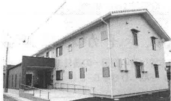
「わだちホーム・しずくホーム」

これをもって、11年以上もお世話になった「北宿ホーム」「第一北方ホーム」の賃貸契約は解約させていただきます。この冬から春、建築されていくホームの様子を見守りつつ、完成・内覧会・引越と続きました。素敵なホームの新築の設計監理を進めて頂いた設計工房庵様及び建築業者の賀真田工務店様には内覧会当日に感謝の意を込めて理事長から感謝状を贈呈させて頂きました。今後、このホームを長く大事に活用していきたいと思っております。