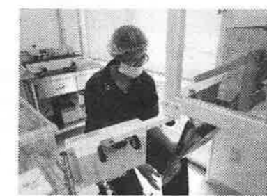
おせんべい袋詰めの様子

おせんべいの協力 ありがとうございます! わかばドリーム作業所では、まずは6月下旬に法人内各作業所関係者に「たまごせんべい」の購入依頼書を配布させていただき、多くの方から注文を頂きました。ありがとうございました。 今後、さらに製造販売が進んでいけるようにと、職員はおせんべいを焼く機械の火の調節等日々奮闘中!! 仲間は袋のシール貼りやおせんべいの袋詰め挑戦!! と、少しずつですが作業にも変化が見られてきたこの頃..... 商品開発もきめ、皆様に愛される「たまごせんべい」となるようこれからも頑張っていきたいと思えます。