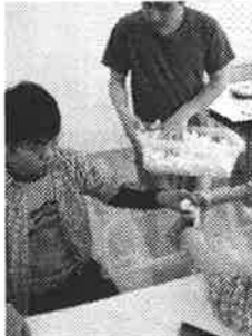
スポンジ詰め…真剣です！

すますまグループは「低反発クッション作り」をしています。材料は大きな低反発マット。それに切り込みを入れたものを手でちぎる人、ハサミで細かく切る人、細かくなったスポンジをカバーに詰める人…それぞれの特技を生かして楽しく作業しています。名鉄一宮駅でのi愛逢マーケットでも売れ筋商品で、今は1か月に60個も売り上げているんですよ！愛情たっぷりさわり心地抜群のクッション、ぜひ一度手に取ってみてくださいね。