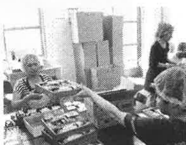
分担作業『お願いします』

キティグループは「うどんのギフトセット作り」をしています。業者さんから預かるのは、中身の食材と、紙のパーツやラベルだけ。そこから、箱や蓋、台のパーツなど、すべて仲間が折ったり、セロテープ止めて作り上げます。もちろん箱詰めも大切な仕事。おいしそうなギフトになるように工夫しながら、丁寧にがんばっています。それぞれの持ち場が板についてきて、職員よりも早く正確にできる仲間もちらほら…！今年のお中元シーズン、たくさんの方の元に届いてもらえるのを楽しみに、張り切っています！