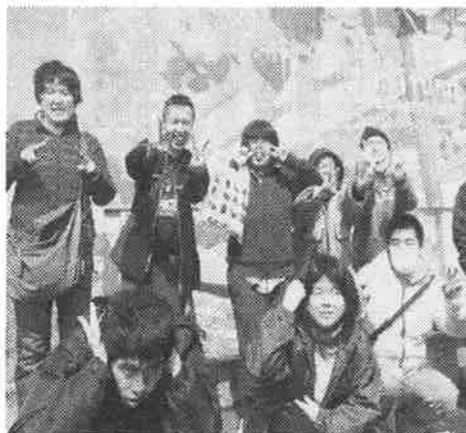
美味しかった後のみんなの笑顔です。