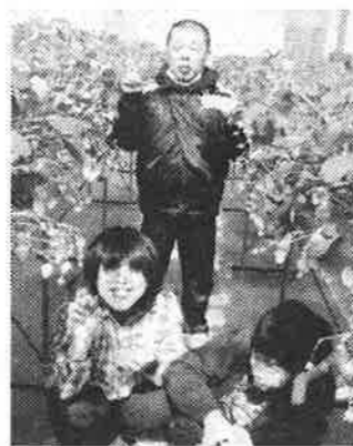
こんなにたくさんの苺です！！